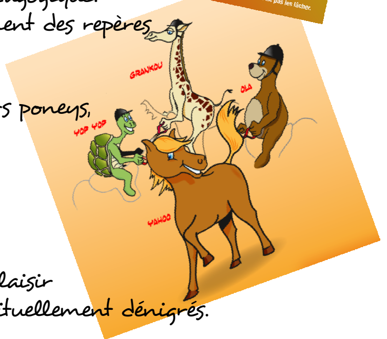
Descriptif technique de vos Equidrive ® Colors